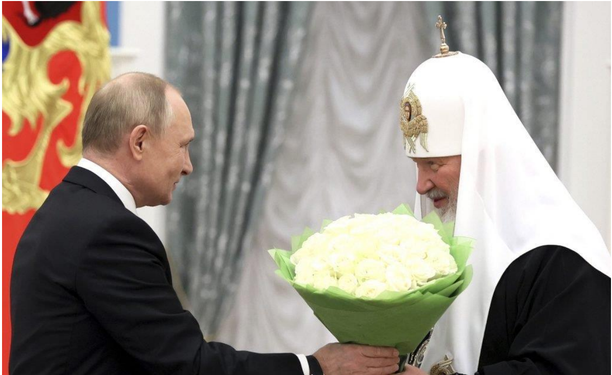
Poetin geeft zijn vriend patriarch Kirill een boeket rozen. De leider van de Russisch-orthodoxe kerk noemde de dictator "een wonder van God".

orthodoxe kerk te vernietigen. Kirill heeft dan ook nog een appeltje te schillen met de de Orthodoxe Kerk van Oekraïne, die zich in 2018 afscheidde van de zijne , en die bovendien de steun kreeg van De oecumenische patriarch van Constantinopel, Bartholomeus I. Als de leidende bisschop van de oude hoofdstad van het Byzantijnse rijk, geniet Bartholomeus enorme status bij alle hoofden van de orthodoxe kerken.