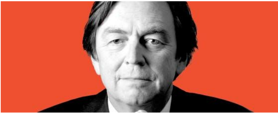
ING - Hans Wijers (opvolger Van der Veer) probeert schade van schikking te beperken door vooroverleg met minister Hoekstra.